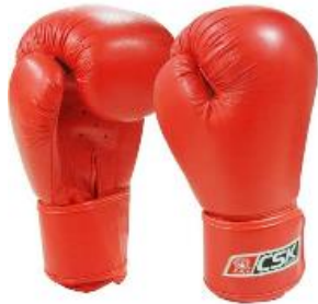
quán jī shǒu tào 拳 击 手 套

❖ “拳”は「拳」で、“击”は「擊」の簡体字で、“拳击”は「ボクシング」の意識語です。