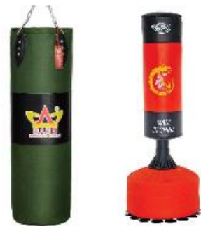
shā dài 沙 袋